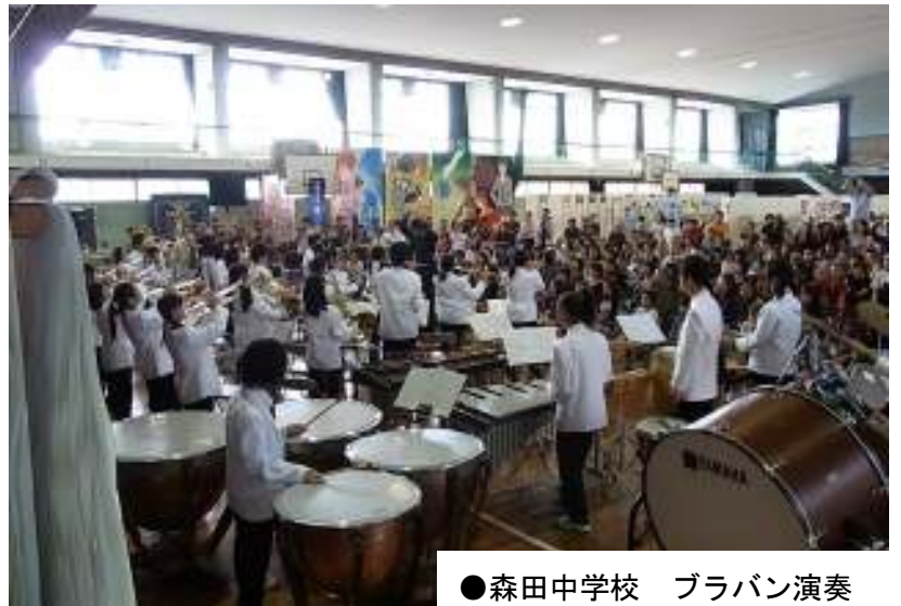
●森田中学校 ブラバン演奏

今年も走りました「森田みらい号」。いや一名前がすばらしい！西ルートの一部変更し、乗車された方には森田地区文化祭、仁愛短大大学祭、共通で使える飲み物引換券も用意しました。乗降者数は昨年並みの325名(次ページ参照)。2日間とも上気分で、自転車でくる方も多く、これで雨模様でしたらもう少し増えていたかもしれません。