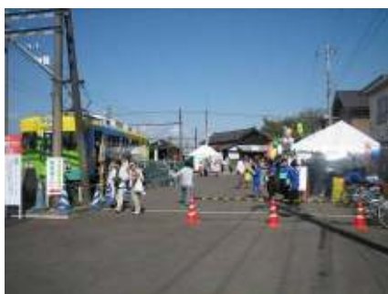
会場から北府駅を見る

やはり行政がしっかり中央に入り、実働部隊が脇を固めるというイベントは力があり、パワーも感じました。本当に多くの来場者があり CFD と比較して羨ましい限りです。