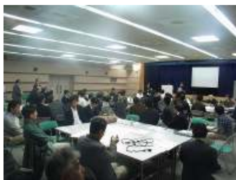
1フロアで4分科会を同時進行