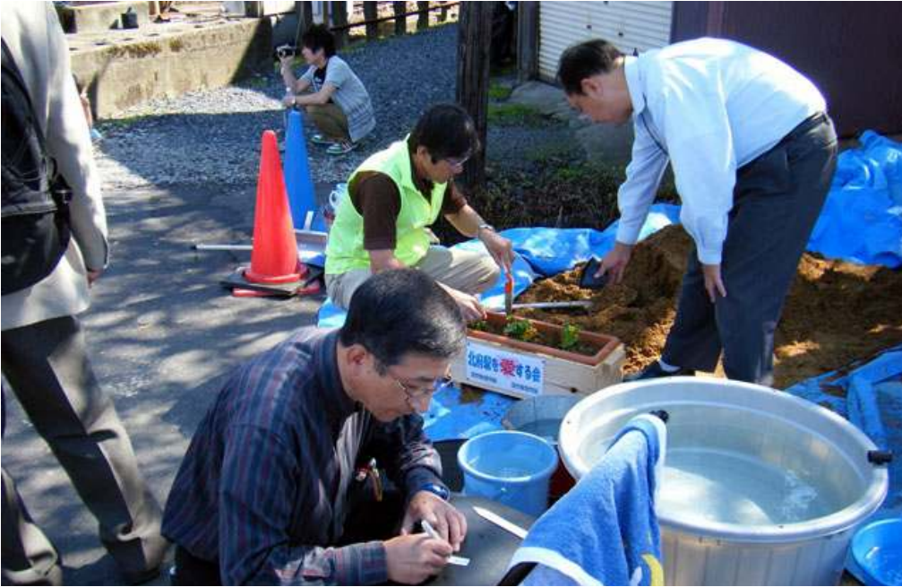
● 関連記事 2～5ページ