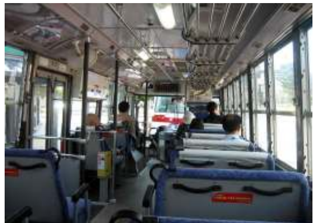
車内風景（ROBA以外は1～2名）