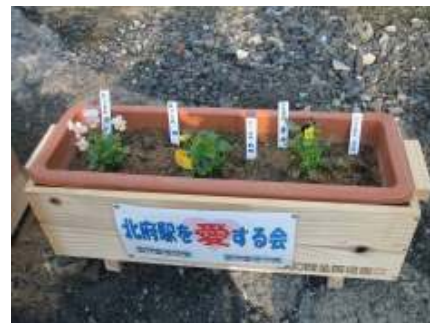
北府駅に ROBA の鉢植えがあります