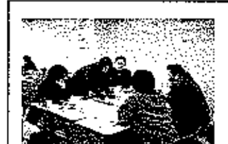
地図を作っています。