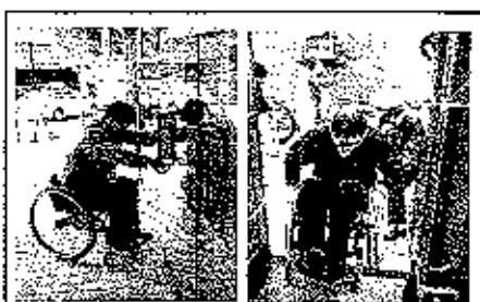
左：LOFTに入ろうと苦戦中 右：すまいるバスから下りる所