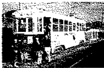
五十嵐ビル・駅前

大学生に対しアンケートを実施して商店街の活性化の一助にしたいとのことから、項目を絞りこみたいと思います。（文・内田）