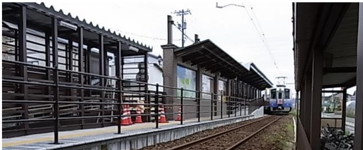
●撮影 林 照 /ハツ島 (えち鉄) 20150411撮影