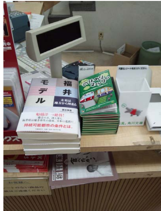
レジ横にならんだ新マップ

表紙付マップは、5月8日から書店（勝木、安部、じっぷじっぷ、紀伊国屋）、バス電車事業者（京福バス、えちぜん鉄道）、福井大学書籍部に先行配布し、販売を開始しました。