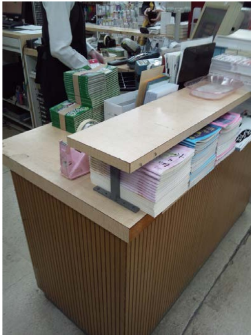
レジに到着したようです、これから配置