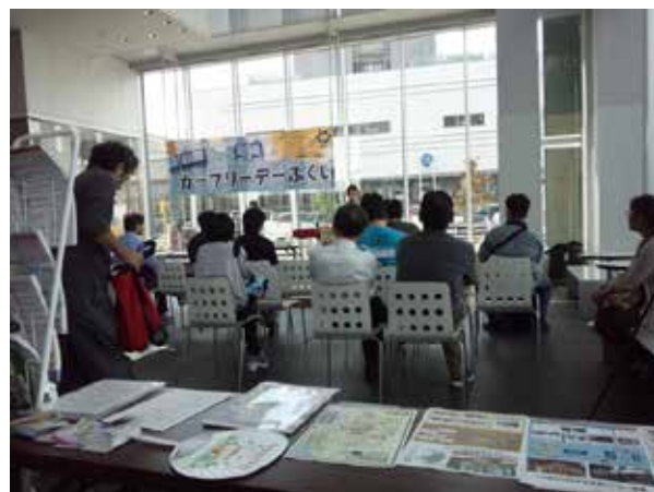
9/19 カーフリーデーステージの様子