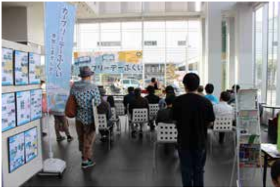
9/19 カーフリーステージ (コンサート): 清水