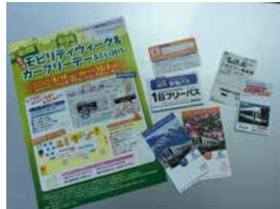
電車バスのフリーキップ (プレゼント)