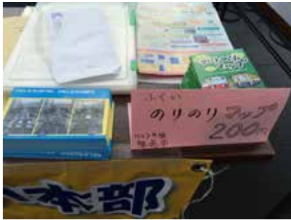
のりのりマップなどの配布品