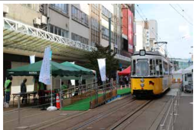
10/4 西武前飯電停の全景とレトラム