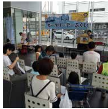
9/19 カーフリーステージ (紙芝居): 畑