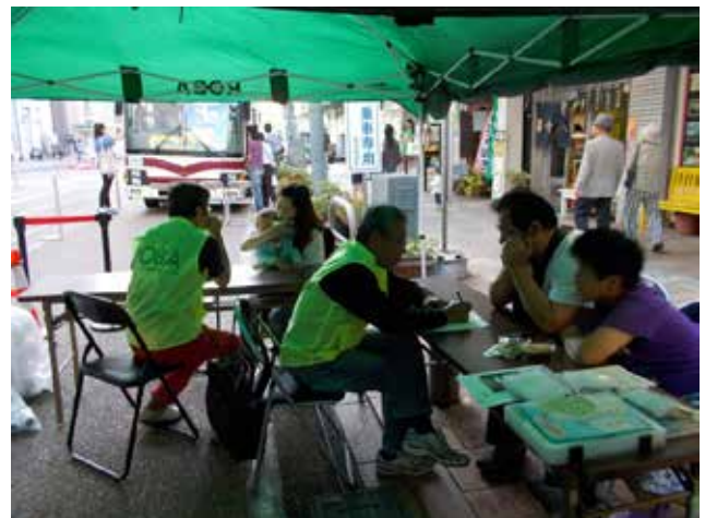
10/4 ちょい旅参加者の報告の聞き取り風景

10/4の「ちょい旅楽しんで賞」は、今年唯一の京福バス福井市内230円区間フリーキップとすまいるバス無料切符を駆使して、まち歩きを楽しんだ学生でした。福井駅前 - [74 清水グリーンライン] - 門前北（カルチャーパーク）藤ヶ丘 - [64 みのり線] - ベル食品館（買物）ベル前 - [70 運動公園線] - 福井駅前 - [34 大学病院線] - 藤島園前（ふくしん：かつ井）トヨペット前 - [21 幾久新田塚線] - 福井駅前 - [12 学園線] - 水越（足羽川散策）若杉 - [71 運動公園線] - 福井駅前という結果でした。見事というわけではありませんが、さらにすごいのが、これを「のりのりマップ」だけを利用して、便数の多そうなところをねらって歩いたということでした。スマホの「京福バスナビ」を紹介したところ、友達スマホを借りてもう一度挑戦したいというので、景品としてもう一枚京福バスフリー切符をプレゼントしました。後日、11/1の大野市での自転車イベントを紹介したところ興味を示してくれ、参加するとのことだったので、やんわりとROBAの紹介もして、一緒に活動しませんかと言っておきました。