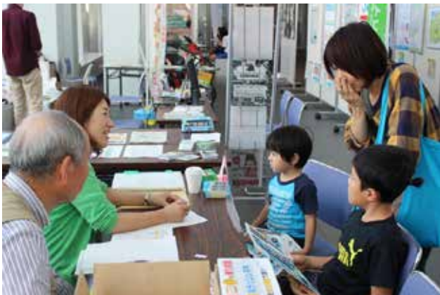
9/19 ちょい旅参加親子への聞き取り（清水）

9/19の「ちょい旅楽しんで賞」は、福井 - 三国湊（まち歩き、ランチ、デザート） - 福井（いったんゴール） - 勝山 - あわら湯のまち（屋台村で夕食） 自宅の夫婦でした。ご主人が、出張先でフリーキップを使い慣れている「ちょい旅の達人」でした、御見それしました。参考にさせていただきます。