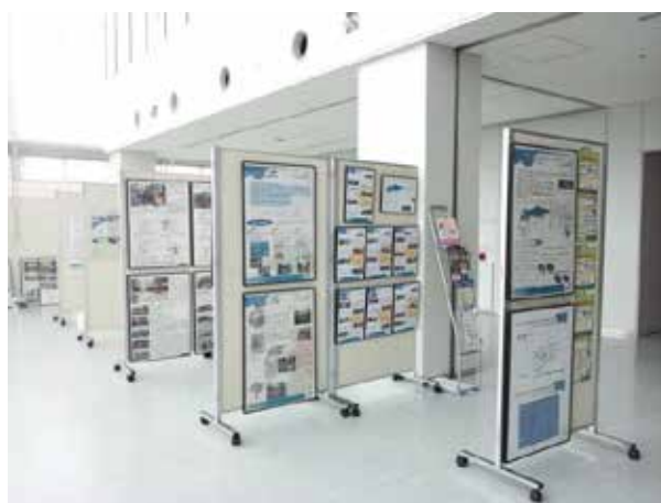
9/16-24 AOSSA 4F モビリティウィーク&カーフリーデーパネル展 その2 (福井県とのコラボ)