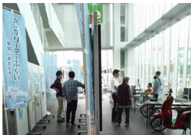
9/19 カーフリーデーパネル展