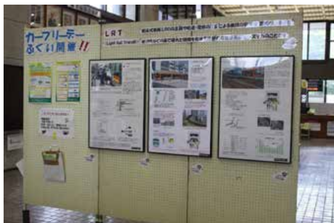
9/7-11 福井市役所1F モビリティウィーク&カーフリーデーパネル展 その1 (福井市とのコラボ)

2013年よりグレードアップしたのは、昨年から始めた1の福井市との共同パネル展、3の福井県との共同パネル展です。それと、「ちょい旅」を事前募集して、参加者を大幅に増やしたことでした。