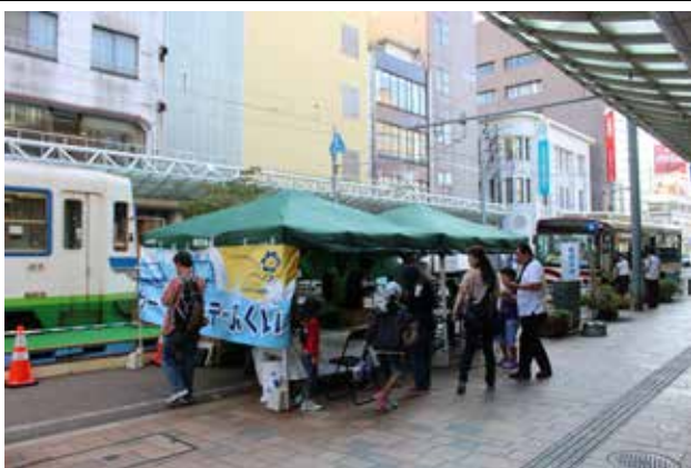
10/4 モビリティセンターの全景: 清水