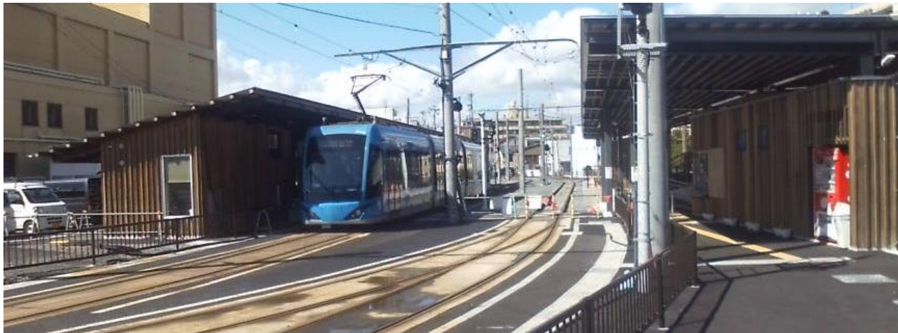
●右の線路が相互乗り入れ用 / 撮影 林照 20160312