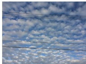
▲ひつじ雲の最盛期