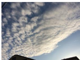
▲ひつじ雲に変化中