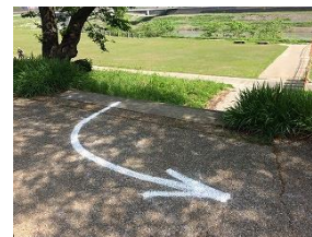
▲迂回路の矢印(歩行者用?)