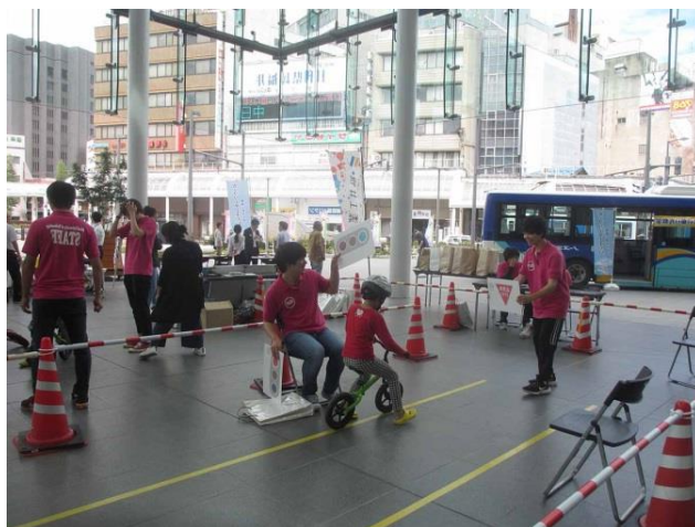
福井工業大学 三寺研究室・吉村研究室による キッズバイク

□来年以降も、みんなで知恵を絞ってさらに参加の輪を広げ、カーフリーデー（というより、クルマの移動に頼らない生活の提案）を社会に呼びかけていきましょう。