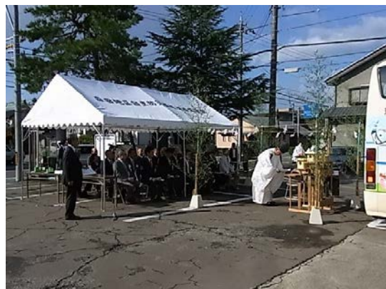
この後 JR 森田駅に回送されて東ルート第1便として運行