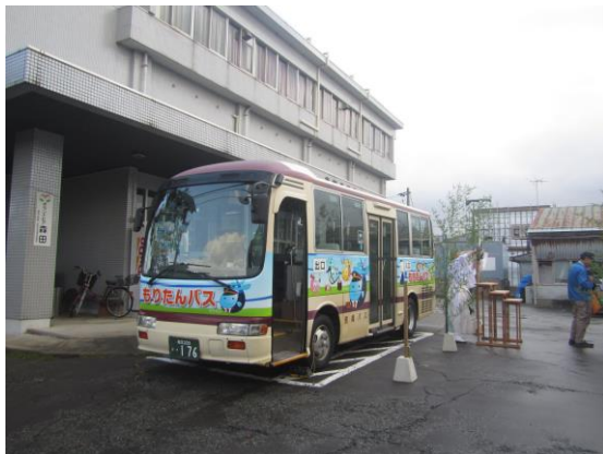
森田公民館で出発式