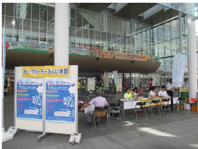
カーフリーデー-本部

比較的好天、かつ温暖な気温で快適に過ごせましたが、ハピテラスの通過交通は思ったほど ではありませんでした。モビリティ・ウィークとしてのハピリンでのパネル展も22日で撤収。 モビリティ・マンスは9月3日～28日（桜木図書館）開催。みなさんご苦労様でした。