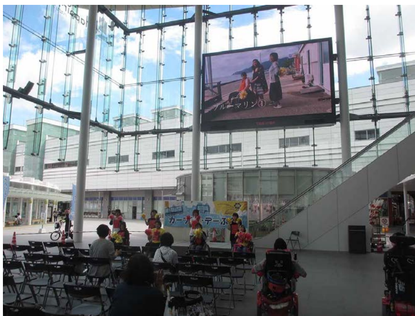
コムサポートさんの ステージパフォーマンス

□しかしながら、今年は新しくコムサポート・プロジェクトさんから多くの参加がありました。 そしてステージでのパフォーマンス披露や動画を使ったプレゼンをするなど積極的な参加を いただきました。