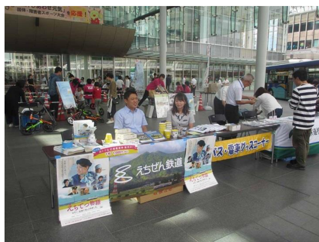
えちぜん鉄道ブース