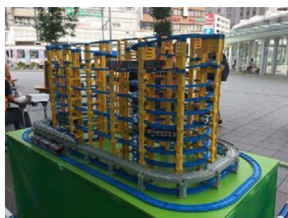
↑プラレールタワー