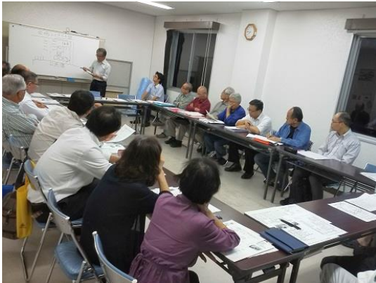
運行協議会(運営会議)の様子

地域のボランティア活動とはいえ、私自身、鉄道かバスに関する仕事がしたいという若いころからの夢が今回ようやく叶いました。地域の皆様の関心も高く、運行開始早々から多くの御意見御要望をいただいております。これから冬場にかけて利用が定着するかが気になるところですが、いただいた御意見を検討し、2年間の試行運転期間中にルートやダイヤの見直しを何度か実施しますので、今後ともご支援いただきますよう、よろしくお願い致します。 (鳥居:記)