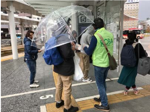
MAP・時刻表を配りながら公共交通案内人

駅前の看板は、4月、10月の改訂にともなう張替えに引き続き、すまいるバスの大幅改定もあったことから、半年で張り替えることになりました。そこで、駅前の総合バスターミナルでは、ショッピングセンターなどの「地域拠点」で乗り継ぐ「乗合タクシー」情報が少なく、わかりにくいという声が多かったため、これまでなかった乗継一覧も追加しました。