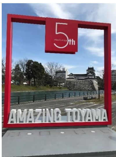
県庁前の富山城址公園 有名なビューポイント

ここでの気づきはライトレールの LRV が市内線を走りますが、電停の高さが電停によってまちまちでした。ライトレールの LRV だと段差がかなりつきます。車いすの乗客は、富山港線ではバリアフリーでも市内線のいくつかの電停ではバリアができてしまいます。