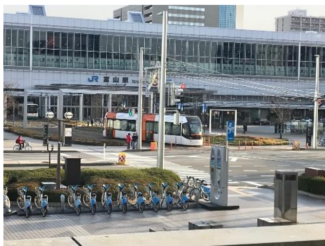
富山駅に入るところ

です。3月20日までは420円要しました。南富山駅からの電車は富山大学前（旧大学前）行の旧型。これはこれで個人的には好きです。途中県庁前で降車。環状線に乗換して富山の街並みや街中を堪能いたしました。ところで、この県庁前電停の時刻表を見ると時間帯によっては1時間に12本の電車が到着します。方面は違いますが5分に1本。びっくりですね。