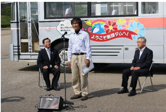
あいさつする私 (市長・私・社長)