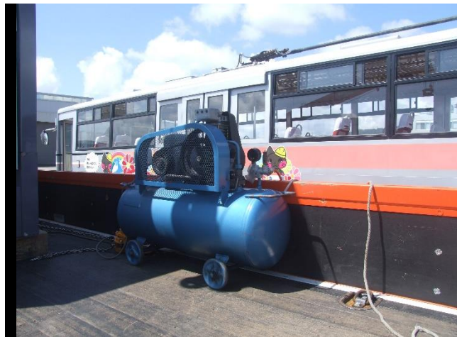
空気圧縮機でエア注入！