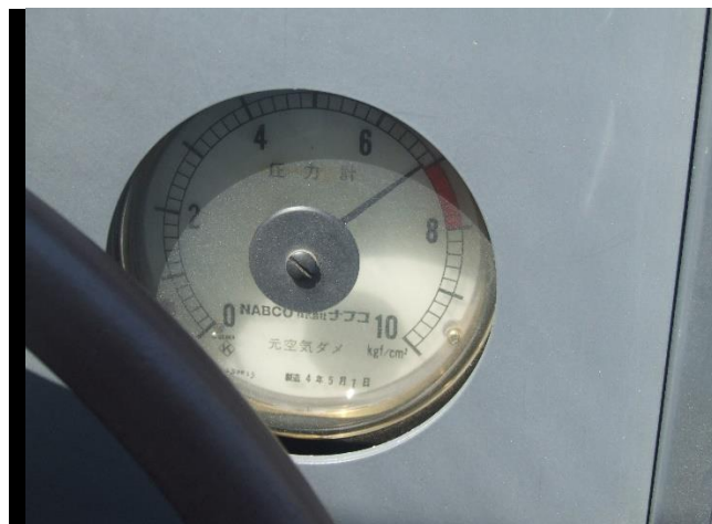
元空気ダムの針がゆっくり上昇！