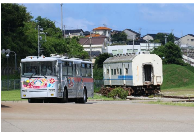
出発式会場まで自走 (隣は 419 系)