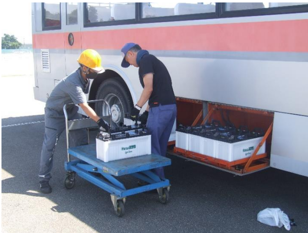
バッテリーを取り換えます