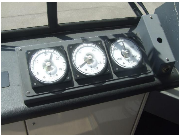
反応した 24V 電圧計 (左)