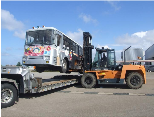
トレーラーに積み込みます