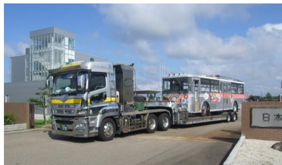
●高岡の解体工場を出発するトロバス