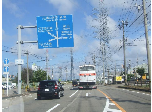
高岡市内を散策、万葉線の線路を横断