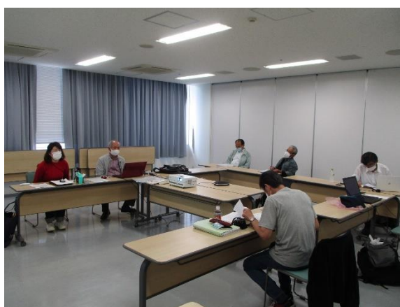
定例総会 会場の様子