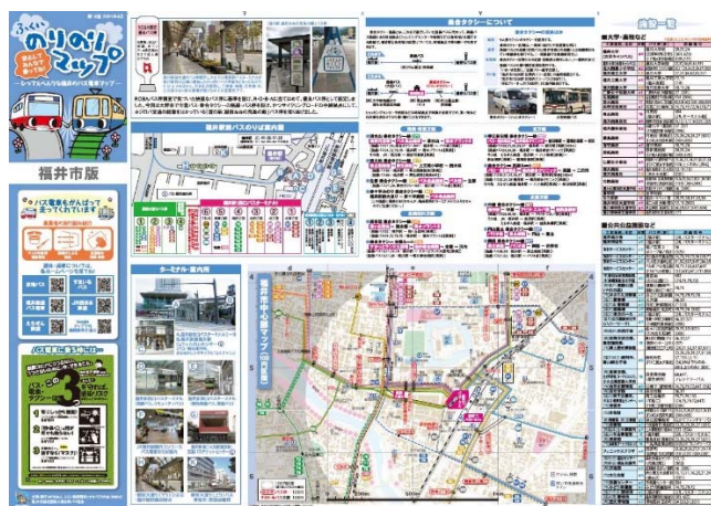
のにのりマップ mini 福井市版 表

まず、県内全市町の全小中学校に対して補助教材として配布してきましたが、福井市を除く寄贈先が県教育委員会から交通まちづくり課に変更され、部数を5部に増やして総計1,200部寄贈しました。内訳は16市町教育委員会と市町立小中学校185校、特別支援学校・私立中学校など18校、合計203校です。寄贈先の変更理由は、新型コロナで県教育委員会から各市町の教育委員会の配布物が増加し、配布の制限がかかったため、交通まちづくり課の「福井県クルマに頼り過ぎない社会づくり推進県民会議（以下県民会議）」のMM（モビリティマネージメント）事業に切り替えて配布してもらうことになりました。NPOの発行する補助教材の配布元としては、こちらの方が適任かもしれません。そのためか、昨年に引き続き今年も、県民会議からのりのりマップの購入の予約が入っており、県民会議のMM資料としてのりのりマップ利用が定着してきているのはうれしい効果です。