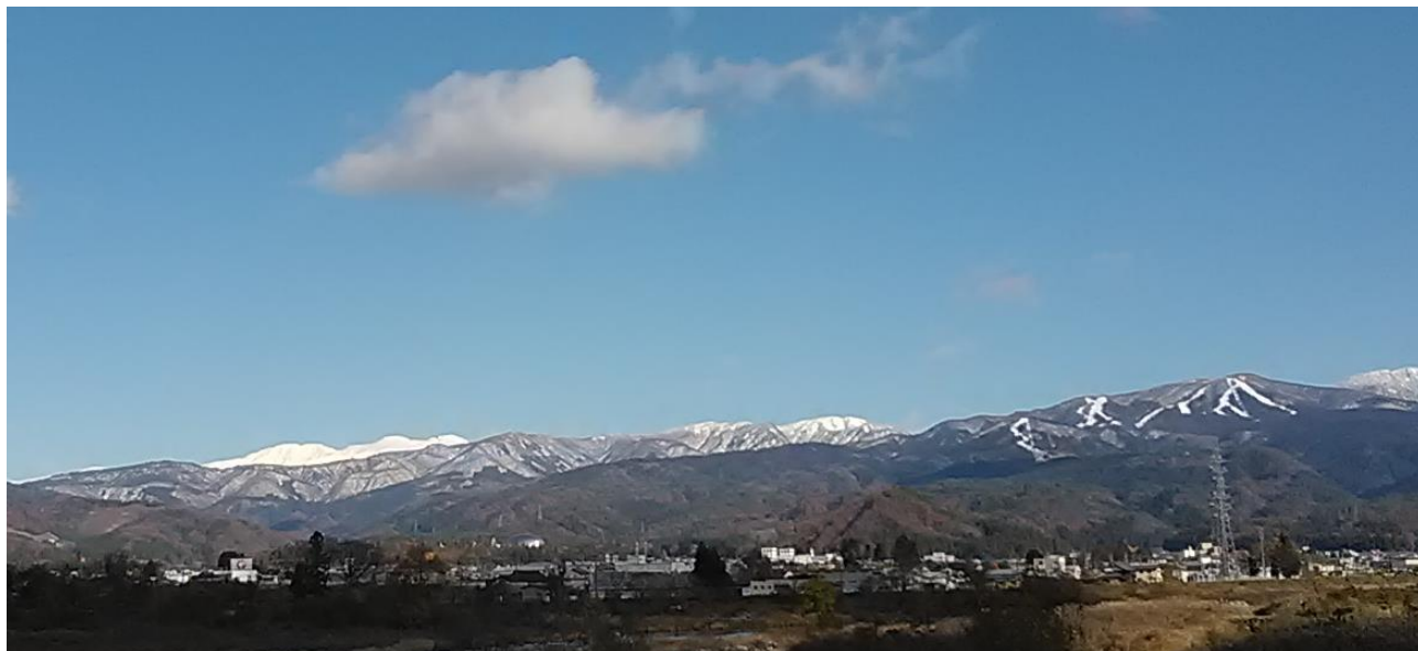
●白山（左奥 積雪）スキージャム勝山（右）／えち鉄発坂駅近く／撮影：変集長 20211128