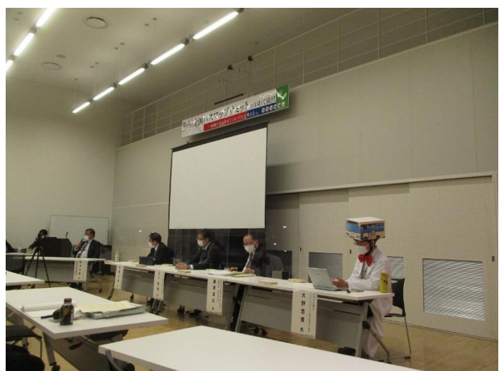
写真5：パネルディスカッション