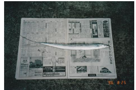
太刀魚のサシミは美味でした！

朝日新聞（2021.10.16）のインタビューでもアイリーン・美緒子（みおこ）・スミスは「封印」「公開」の経緯を詳しく述べている。