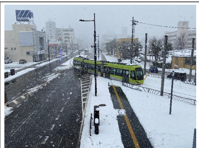
旧8号線のきれいに除雪された芝生軌道ならぬ 「白雪軌道？」に乗り入れするフクラム