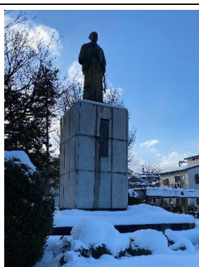
左内公園の橋本左内像

また、前回のふるさと百景調査隊で提案のあった、路面電車で訪れる風景も撮影してみました。