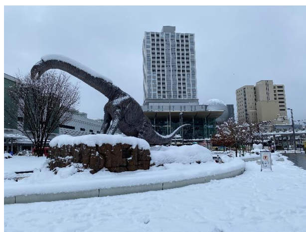
恐竜と雪と福井駅ターミナル