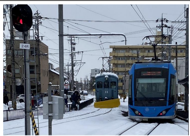
田原町駅に移動したラッセル車に群がる撮り鉄

途中で吹雪いてきて、もちろん傘などさしてはもらえず、歩道橋の上まで駆け上がってスマホを構え ました。そんな過酷な時ほどいい写真が撮れますね。