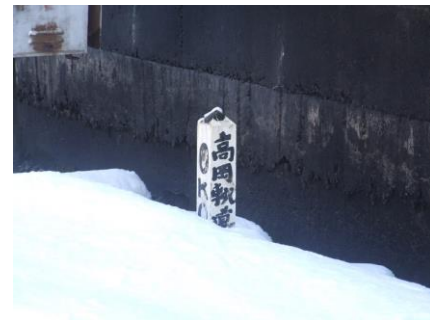
写真は、万葉線、六渡寺駅の「0キロポスト」

で、上り下りは、どう決めるのか？ これは起点から終点に向かうのが“下り”、逆が“上り”なのは、皆さんご存知の通り。 それでは「起点」は、どう決めるのか？ 一般的には、東京よりが起点、枝線は東京につながっている接続本線側、その他は大きな町側が起点。大体この考えで決められますが、中には、あれっ！？ というものも。