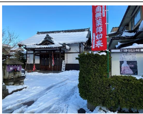
お市の方の菩提寺である自性院