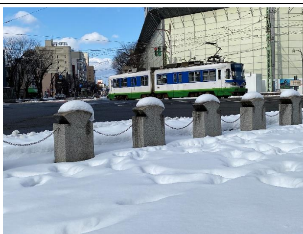
大名町交差点の雪のある風景