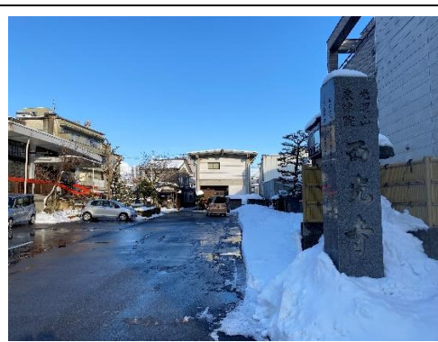
西光寺と柴田勝家資料館