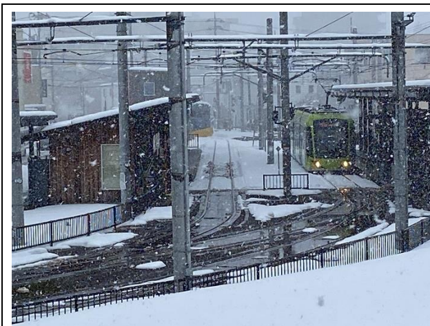
作業を終えて奥で待機するラッセル車と、えち鉄 から福鉄へ乗り入れするフクラム

途中で吹雪いてきて、もちろん傘などさしてはもらえず、歩道橋の上まで駆け上がってスマホを構え ました。そんな過酷な時ほどいい写真が撮れますね。