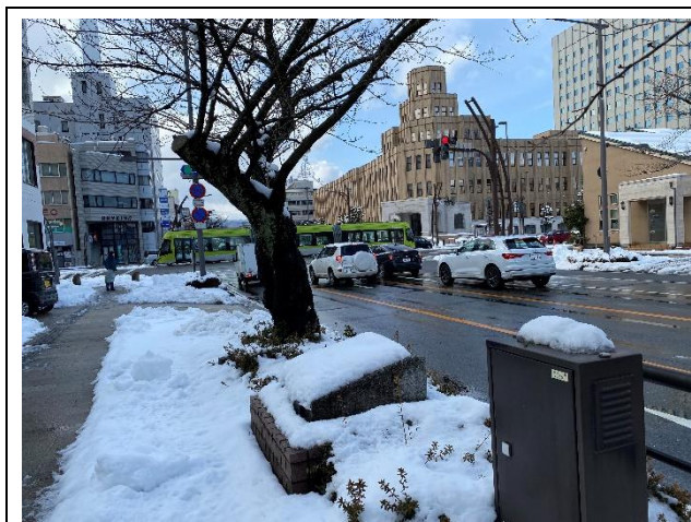
裁判所前交差点付近の雪のある風景