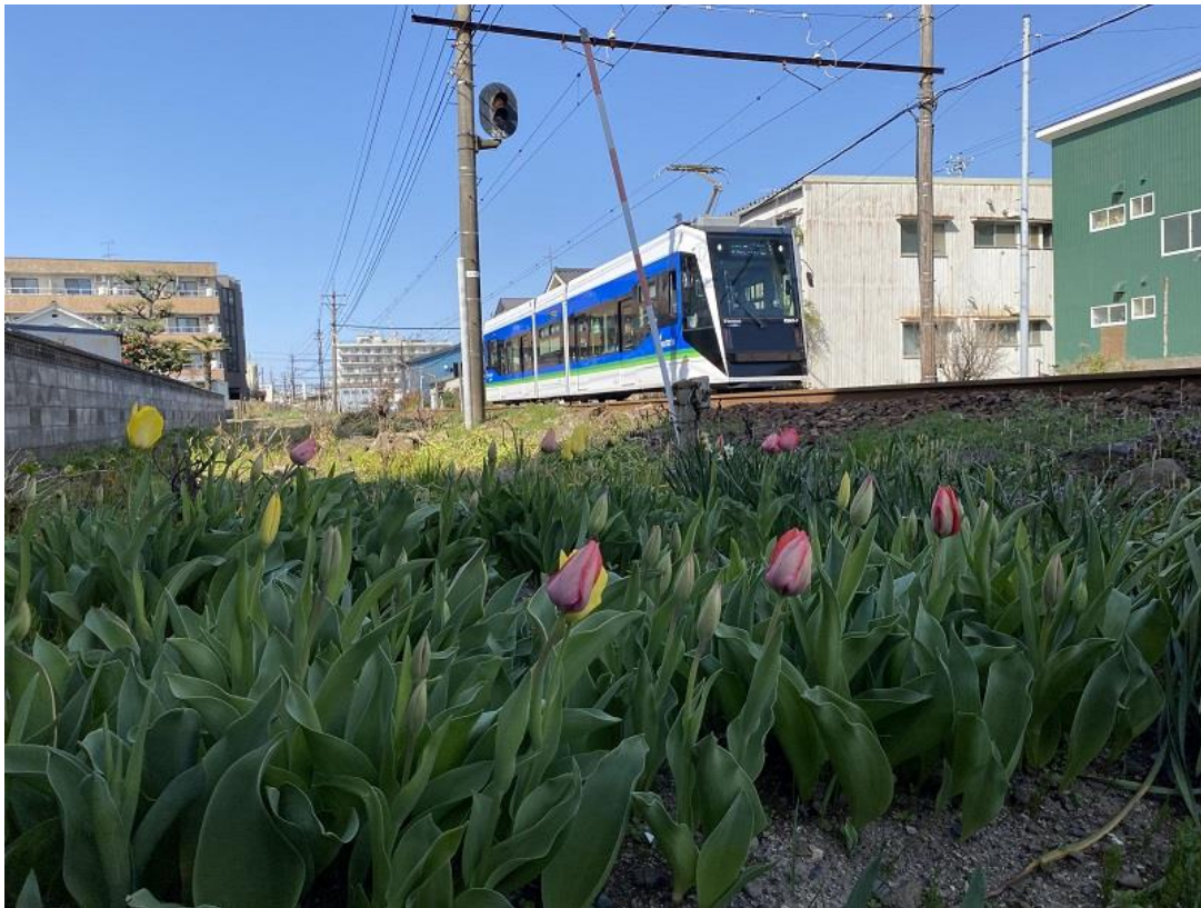
* F 2 0 0 0 形