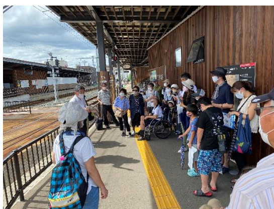
体験会の事前説明

体験会は、調査の主だったポイントを使い、路面電車のある風景の街角スポットでの見学会やバリアフリー体験、電車からの風景スポットなども楽しんでもらった。