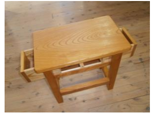
上:引き出し付きの椅子 (材:ケヤキ、杉)