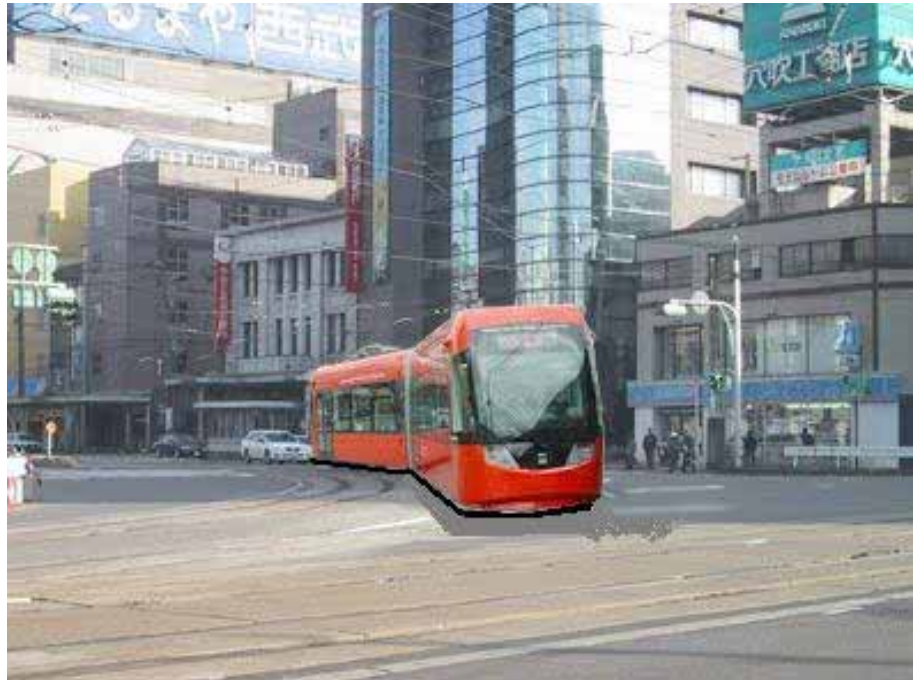
大名町交差点にLRVの走る合成写真。いつかは・・・

このたび、福井鉄道のダイヤが改正されました。目立つ改正点は、水落、家久、西武生に新たに急行が止まるようになり、準急が廃止されたこと。それにより田原町行き急行が朝一本出現し、裁判所前にも止まることになりました。同時期にJRのダイヤが改正されて福井 - 武生間がほぼ30分間隔となりましたので、福井鉄道として差別化を図る形となりました。新たに急行の止まる水落駅には、同時にパークアンドライド駐車場が整備されました。