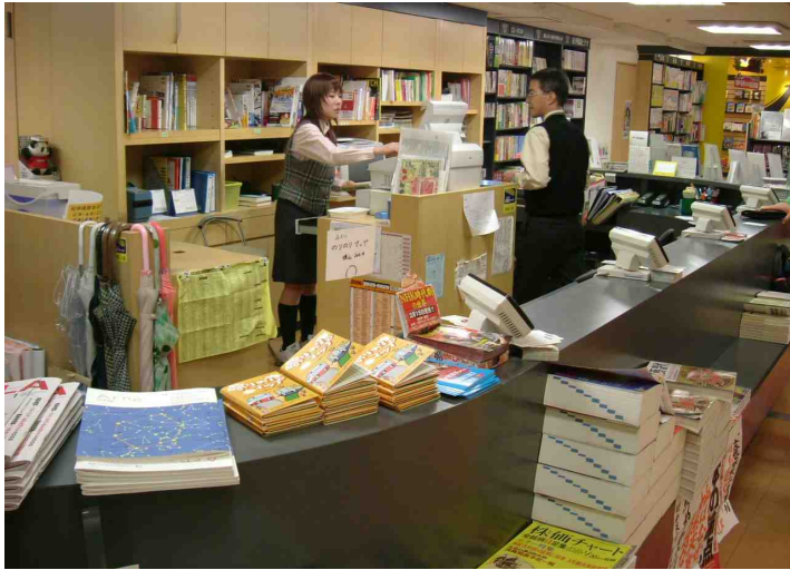
紀伊国屋書店 / 福井西武（福井市） 月に 20 冊ほど売れているらしい。撮 影時は福井西武で許可を受けましょ うね。