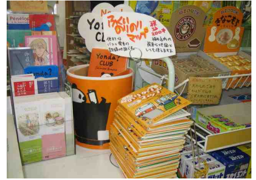
じっぷじっぷ 種池店（福井市） カウンターでかわいく置かれて いました （撮影報告 / 内田）