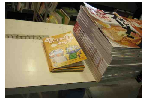
勝木書店 / ワッセ店（福井市） もう在庫がなくなってきた。結構 売れていますとのこと