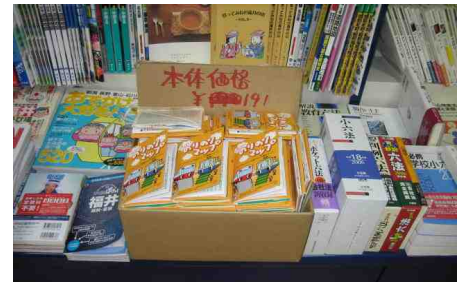
福大生協（福井市） 12月から3冊ほど売れました。3 月以降新生には良いのではないかと のこと。奥の場所から、カウンター へ移動するよう依頼しました。