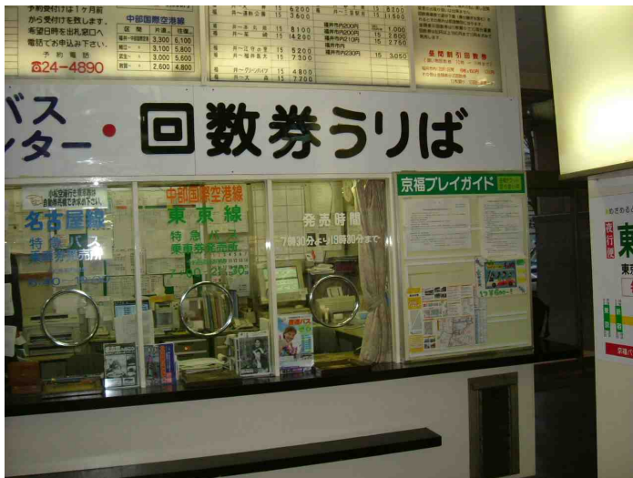
京福バスターミナル（福井市） ぼちぼち売れているらしい。