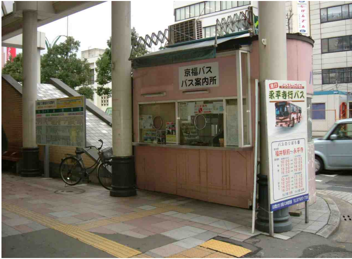
京福バス・市内バス案内所（福井市） 最初、のりのりマップは窓口に置いて なかったので、お願いして出してもらい ました。宣伝用グッズが必要か？ （撮影報告 / 林照）