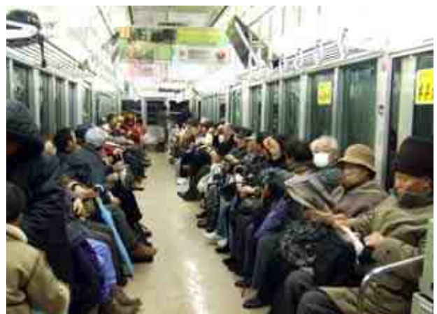
車内 / 帰り