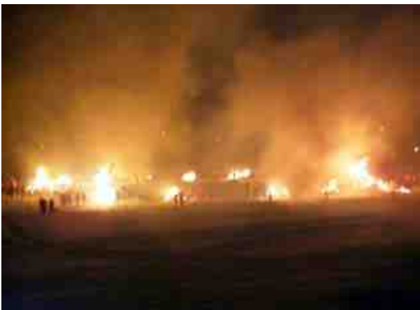
左義長 / 勝山大橋から撮影