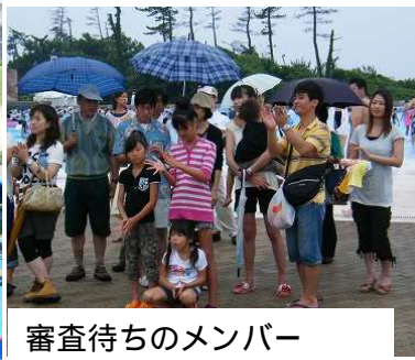
審査待ちのメンバー