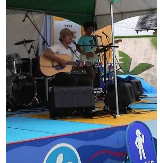
グランプリを獲得 証さん