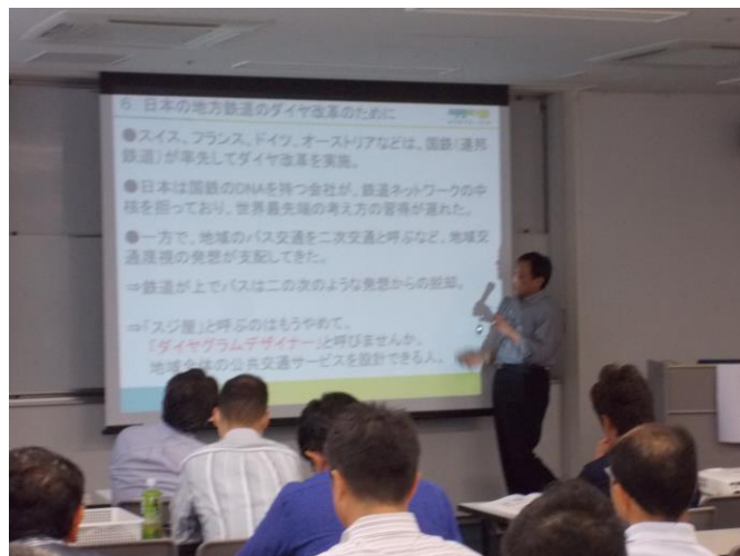
●関連記事 2ページ／講演会の内容は後日掲載予定